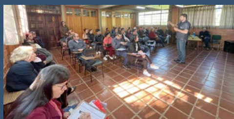
Regional Centro-Sul – Guarapuava - 19 de abril.