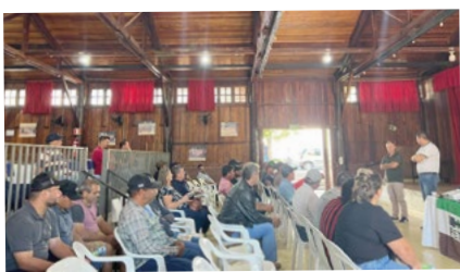
São João do Ivaí – Regional Vale do Ivaí

A cada nova edição do Jornal da FETAEP postaremos mais fotos do Giro Sindical! Confira mais fotos na próxima edição!