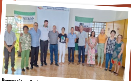
Paranacity – Regional Noroeste Umuarama.