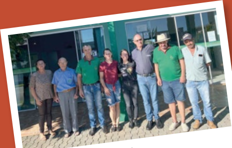
Clevelândia – Regional Sudoeste.