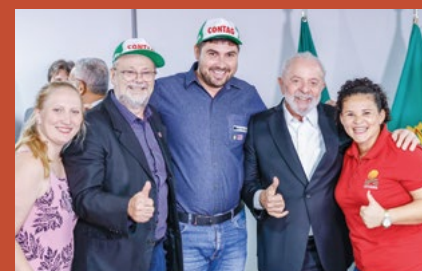
Representantes da FETAEP, da CONTAG e das demais Federações do Brasil entregam pauta ao presidente Lula.