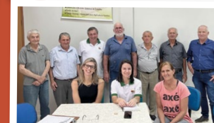
Mandaguçu – Regional Noroeste Paranavai.