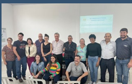
Regional Campo Mourão – Araruna - 15 de maio.