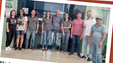
São Jorge do Patrocínio – Regional Noroeste Umuarama.