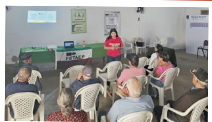
Regional Campo Mourão – Apucarana