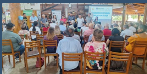
Regional Noroeste Umuarama – Umuarama - 24 de abril.