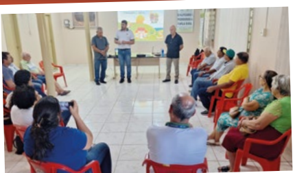
Icaraíma – Regional Noroeste Umuarama.