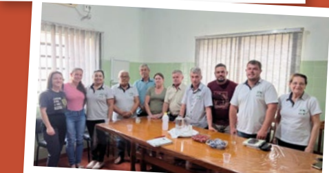
Iporã – Regional Noroeste Iporã.