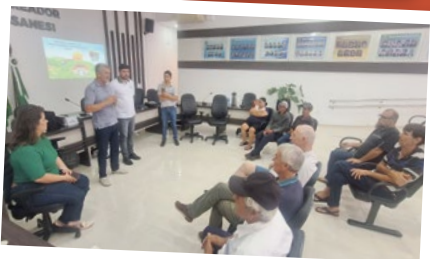
Bom Jesus do Sul – Regional Sudoeste.