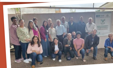
Ubiratã – Regional Campo Mourão.