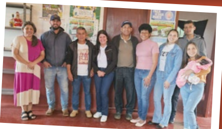
Altamira – Regional Campo Mourão.