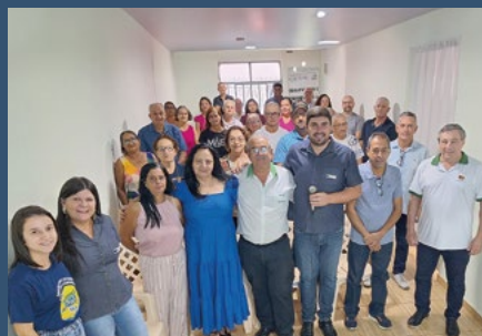
Regional Noroeste Paranavaí – Paranavaí - 26 de abril.