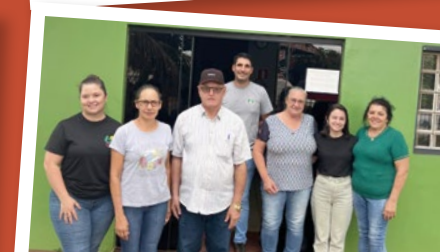
Jesuítas – Regional Oeste.