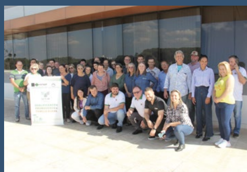
Regional de Curitiba – Curitiba - 11 de junho.