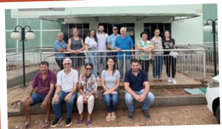
Altônia – Regional Noroeste Umuarama.