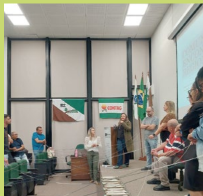
FETAEP – em parceria com o Senar – investe na formação de sua rede de comunicadores populares. Na foto, formação com a Regional Norte da FETAEP.

A Federação retomou os processos formativos com a ENFOC Jovens e Mulheres, realizada entre 2022 e 2023. A formação contou com quatro módulos: Curitiba, Icaraíma, Colorado e São Miguel do Iguaçu.