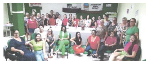
São Jorge D'Oeste