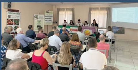
Regional Sudoeste – Pato Branco - 10 de abril.