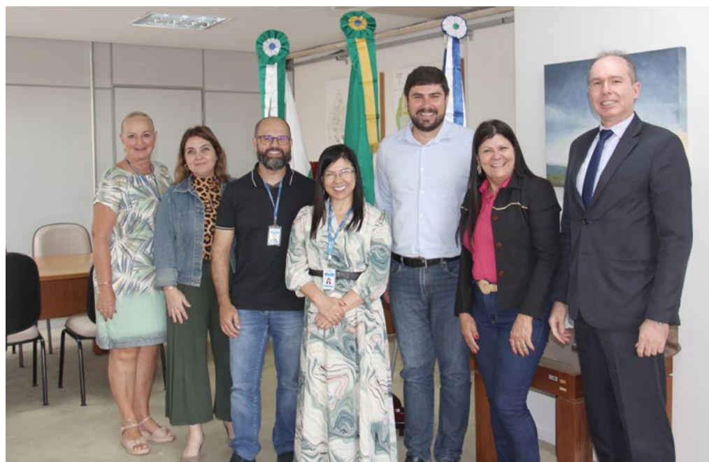
Com o propósito de abrir um canal de diálogo e comunicação é que a FETAEP visitou a Gerência do INSS.

Durante o encontro foram apresentadas pautas e demandas relativas aos trabalhadores rurais – principalmente no que diz respeito à concessão dos benefícios previdenciários ao segurado especial. Na ocasião, o presidente da FETAEP também pontuou a necessidade de ampliar no estado do Paraná o acesso dos Sindicatos ligados à Federação ao INSS Digital. “Nossa meta é capacitar e fornecer condições para que 100% da nossa base possa operacio-