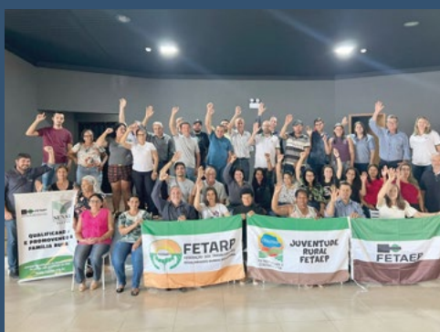
Regional Norte – Astorga - 14 de junho.