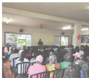
Agudos do Sul