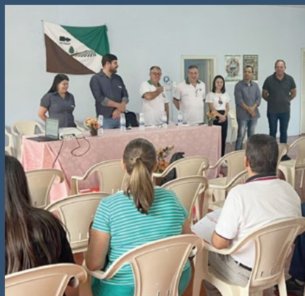
Regional Vale do Ivaí – Jardim Alegre - 17 de maio.