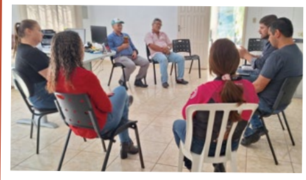
Nova Laranjeiras – Regional Centro Sul.