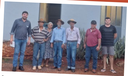
Catanduvas – Regional Oeste.