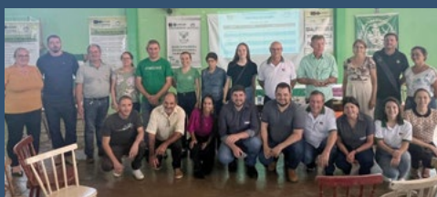
Regional Oeste – Missal - 12 de abril.