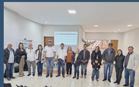
Regional Norte Pioneiro – Carlópolis - 28 de maio.