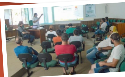
Flor da Serra do Sul – Regional Sudoeste.